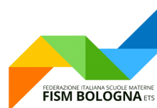
TABELLA RIASSUNTIVA CORSI FORMAZIONE SETTORE PEDAGOGICO

Ambito: I fondamentali del “nostro” fare scuola